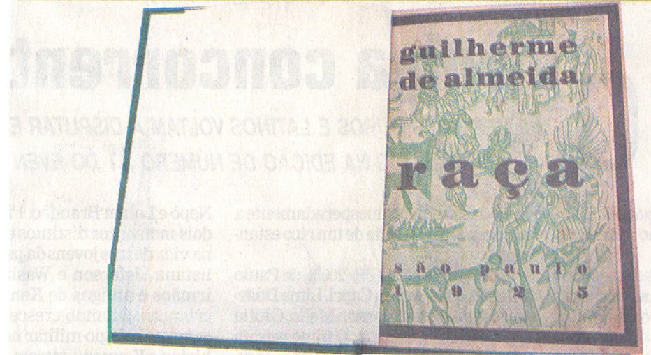
Itens que integram a Mostra de Livros das Coleções de Obras Raras e Especiais, na Biblioteca Central da Unicamp: em cartaz até dia 31