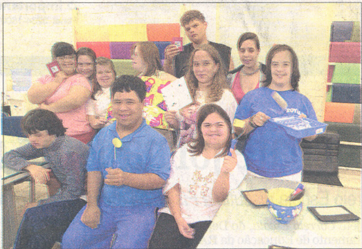
Grupo durante atividade educacional: novas chances