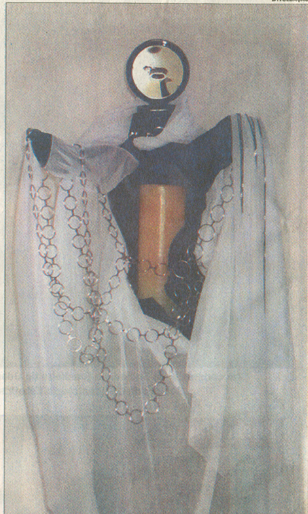
Obras que estarão em exposição a partir de hoje, no Sesc/Campinas