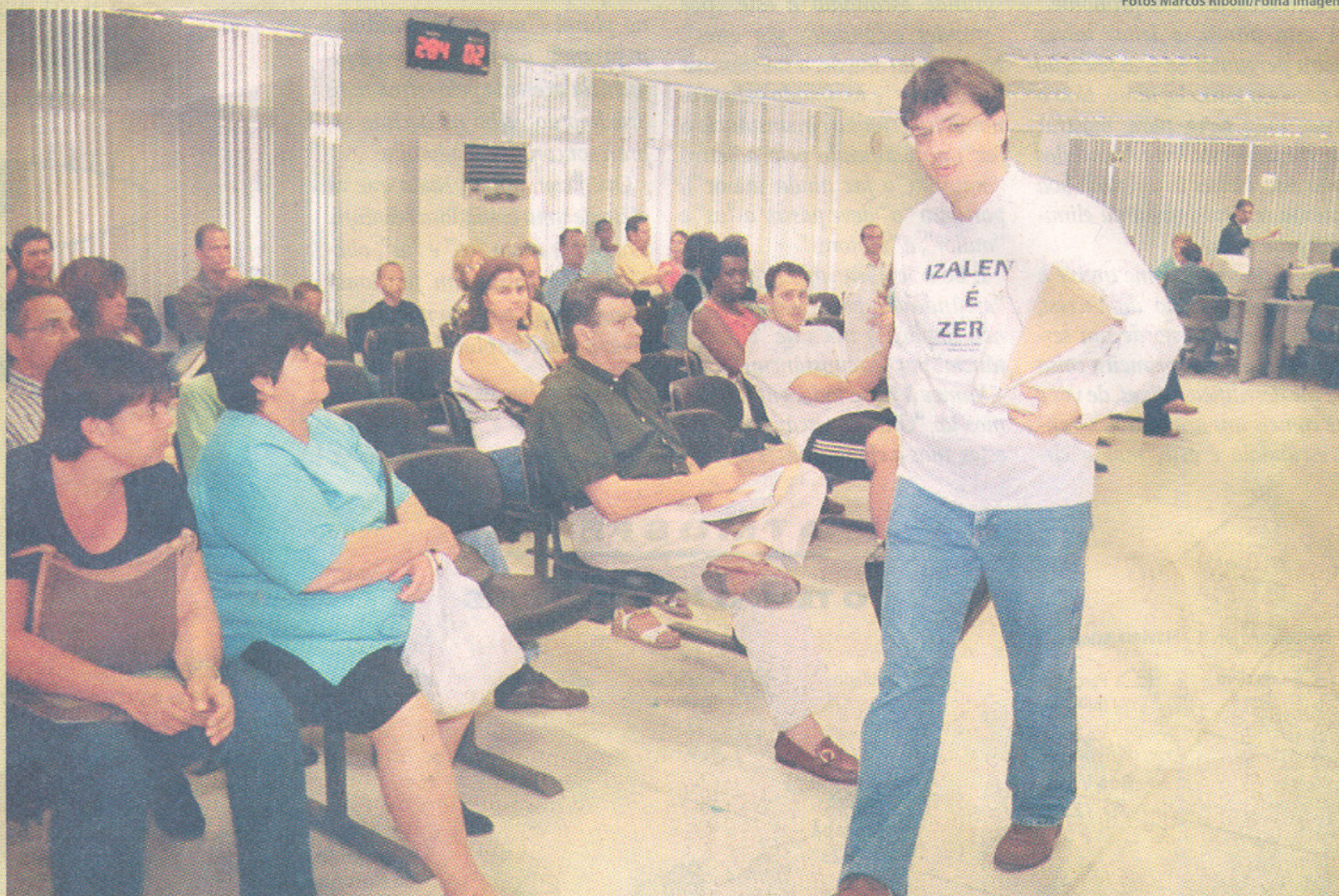
Contribuintes aguardam em guichê no Paço Municipal de Campinas, onde valores da dívida ativa podem ser negociados