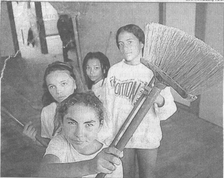
Alunos que participaram do mutirão, ontem: cidadania