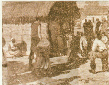
No Jardim Tamolo, charrete passa pela antiga estrada para Goiás, onde ainda se conserva a sede da fazenda Proença. Na foto acima, capela interina em 1774