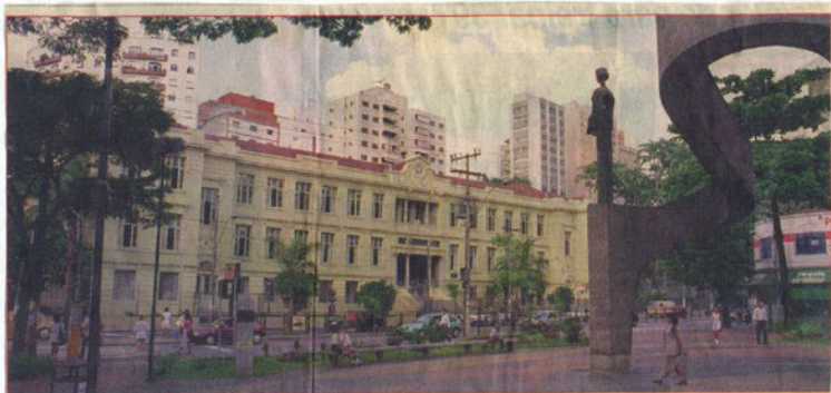
Colégio Carlos Gomes já era tombado pelo Condephaat de São Paulo, desde 1982; Condepacc apenas ratificou a importância da preservação do imóvel