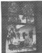
Bandeiras iguais em mais de 40 janelas