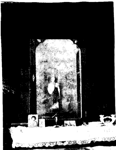
Na capela, apenas o oratório

Dos áureos tempos de produção de café, restaram somente alguns cartões, que serviam para a confirmação da colheita para os compradores. Nos cartões estão impressos o nome da fazenda (São Joaquim), o nome do proprietário (Celestino De Cicco), e o vale, equivalente a um alqueire de café.