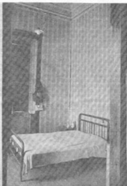
Papel de parede importado da França