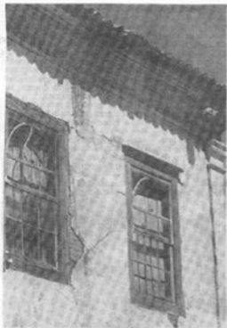
Ação do tempo danificou imóvel