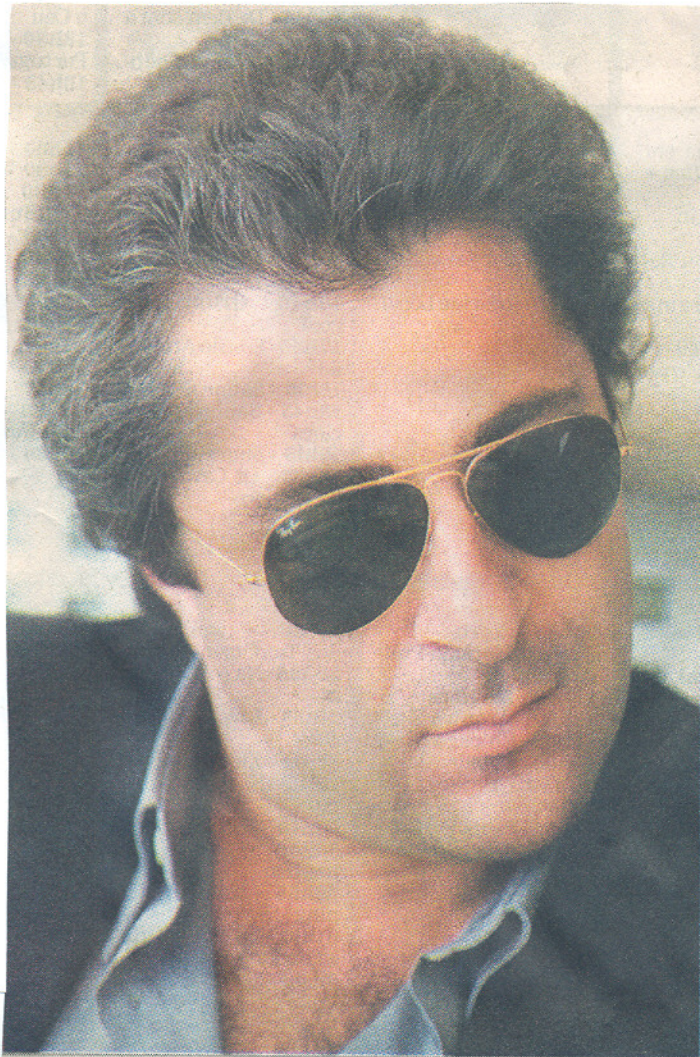
Francesco La Vecchia: maestro rege Orquestra da Romênia