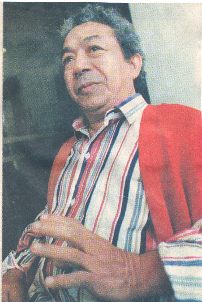
Joãozinho Trinta: carnavalesco assina montagem da ópera