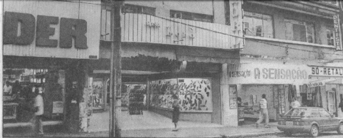
A fachada da Casa Lord continua a mesma de três décadas