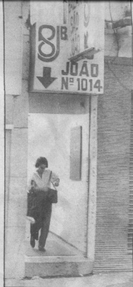
O corredor estreito de entrada do Bazar de São José é o mesmo de 25 anos