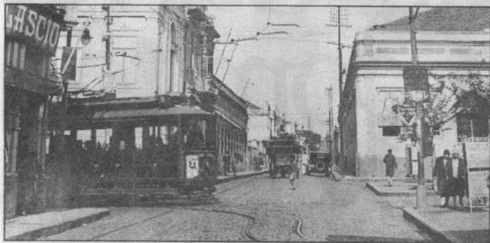
Na esquina da Glicério com Conceição estava a Casa di Lascio