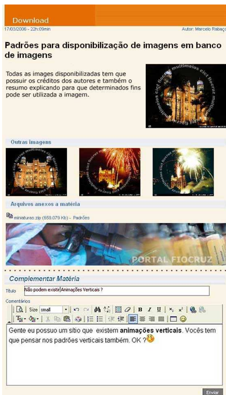
Figura 3 – Matéria publicada na Comunidade Virtual Fiocruz.

Já a Comunidade Virtual Fiocruz possui até agora 14 comunidades, separadas em 48 grupos, como mais de 800 usuários, com aproximadamente 1000 matérias publicadas, com 700 documentos, cerca de 200 MB de informações. O sistema está sendo utilizado para as mais diversas finalidades: grupo de discussão, repositório de documentos, histórico de procedimentos, memórias de reuniões, administração de cursos, ensino, comunidade virtual, divulgação científica, administração de recursos humanos, desenvolvimento de pesquisas, comunicação entre centros espalhados pelos Brasil e América do Sul. O endereço para o acesso é http://www2.fiocruz.br/comunidadefiocruz .