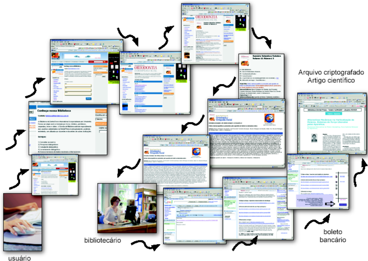
Esquema 1 – Sistema de consulta, leitura de resumos, encomenda e pagamento online de Artigos Científicos da Biblioteca Dental Press.