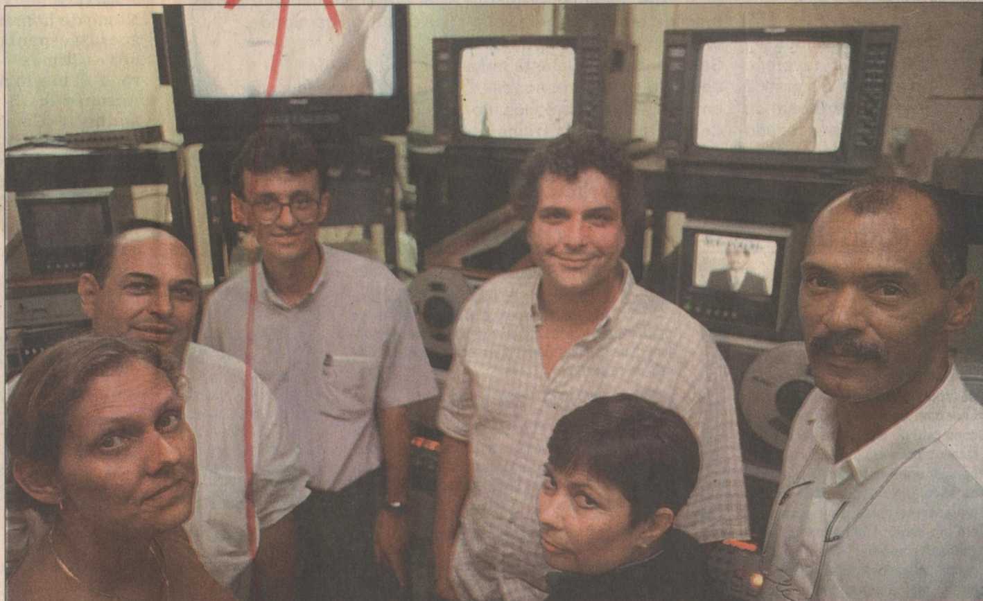
Integrantes da equipe de produção dos programas: Unicamp ganha a TV