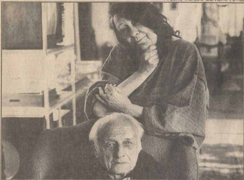
Lina Bo Bardi e Verger: talentos da cultura erudita na Bahia