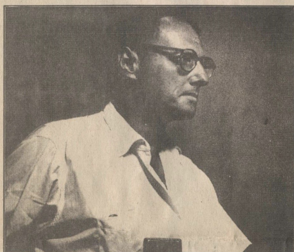
Auto-retrato do antropólogo francês Pierre Verger