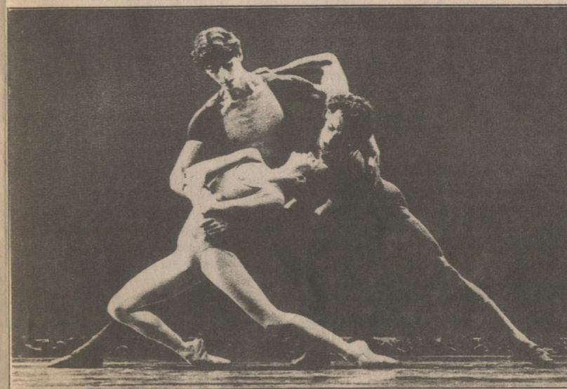
Cena de coreografia de Kilian: o melhor, segundo Garcia

para cá — e isso em todas as áreas, do cinema e teatro à música e dança — é que o espetáculo não está tanto para o intérprete mas para aquele que concebe e dirige. É a vez do metteur en scène. Hoje vamos ao cinema para ver um filme de Kurosawa e não determinado ator ou atriz. Vamos ver os balés de Kilian e não os bailarinos de Kilian.