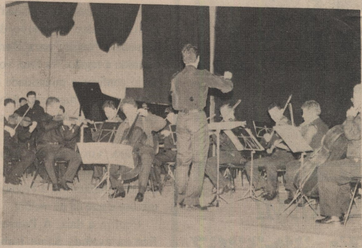
A Orquestra Sinfônica se apresentou no auditório do Instituto de Artes

A Orquestra Sinfônica da Universidade Federal do Cuiabá se apresentou no último dia 18 de agosto no auditório do Instituto de Artes da Unicamp. A Orquestra é a única no País a fazer montagem de composições do século XX. A apresentação fez parte do Festival Música Nova, produzido pela Secretaria Estadual da Cultura e pela Sociedade Ars Viva.