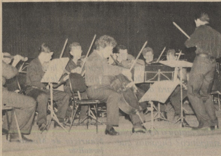
A apresentação foi feita no auditório do Instituto de Artes

A Orquestra Sinfônica da Universidade Federal de Cuiabá (MT) se apresentou no último dia 18 de agosto no auditório do Instituto de Arte da Unicamp. A apresentação fez parte da trigésima edição do Festival Música Nova, promovido pela Sociedade Ars Viva e pela Secretaria Estadual de Cultura.