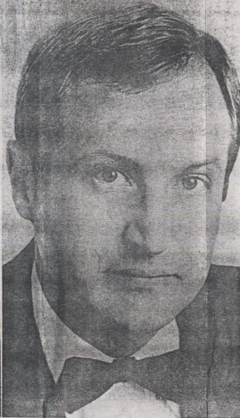
O pianista e compositor mexicano Max Lifchitz toca quarta no Masp.