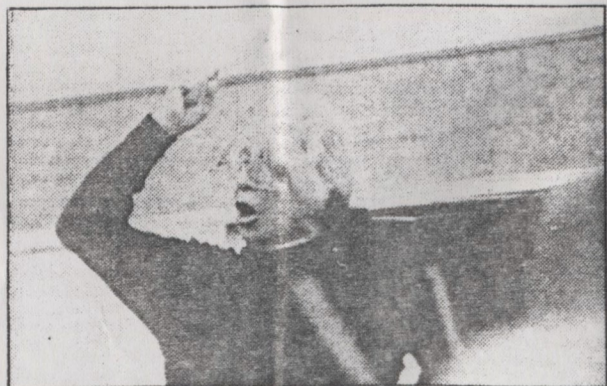
...se o público tradicional de concerto...