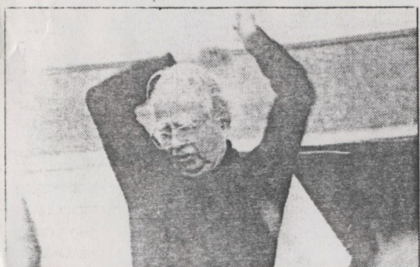
Koellreuter regendo: sem se preocupar...

encerramento do 26º Festival Música Nova. No programa, Koellreuter, Villa-Lobos e Lindemberg Cardoso. Ingressos: Cr$ 300,00 e Cr$ 150,00 (estudantes).