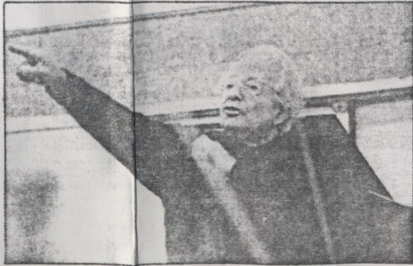
...vai torcer o nariz ou os ouvidos...