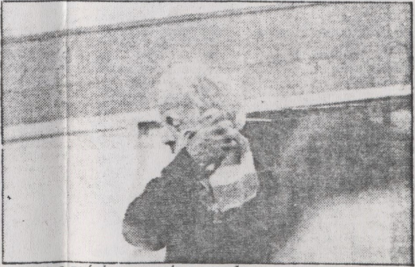
...para a música que ele compõe