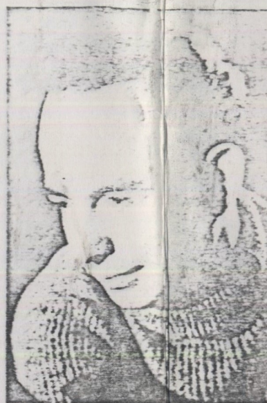
Em 1948, quando liderava o movimento Música Nova