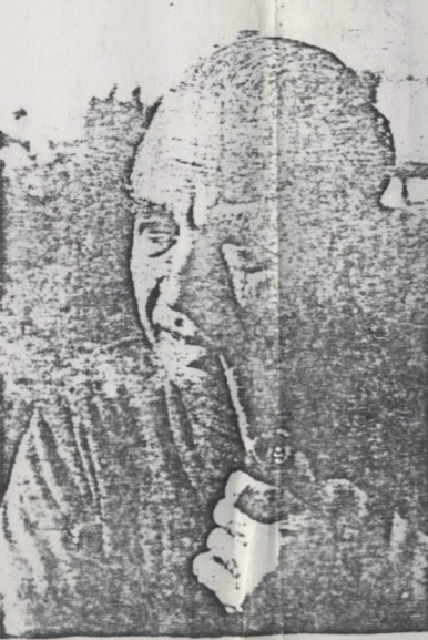
Ao voltar ao Brasil, em 75.