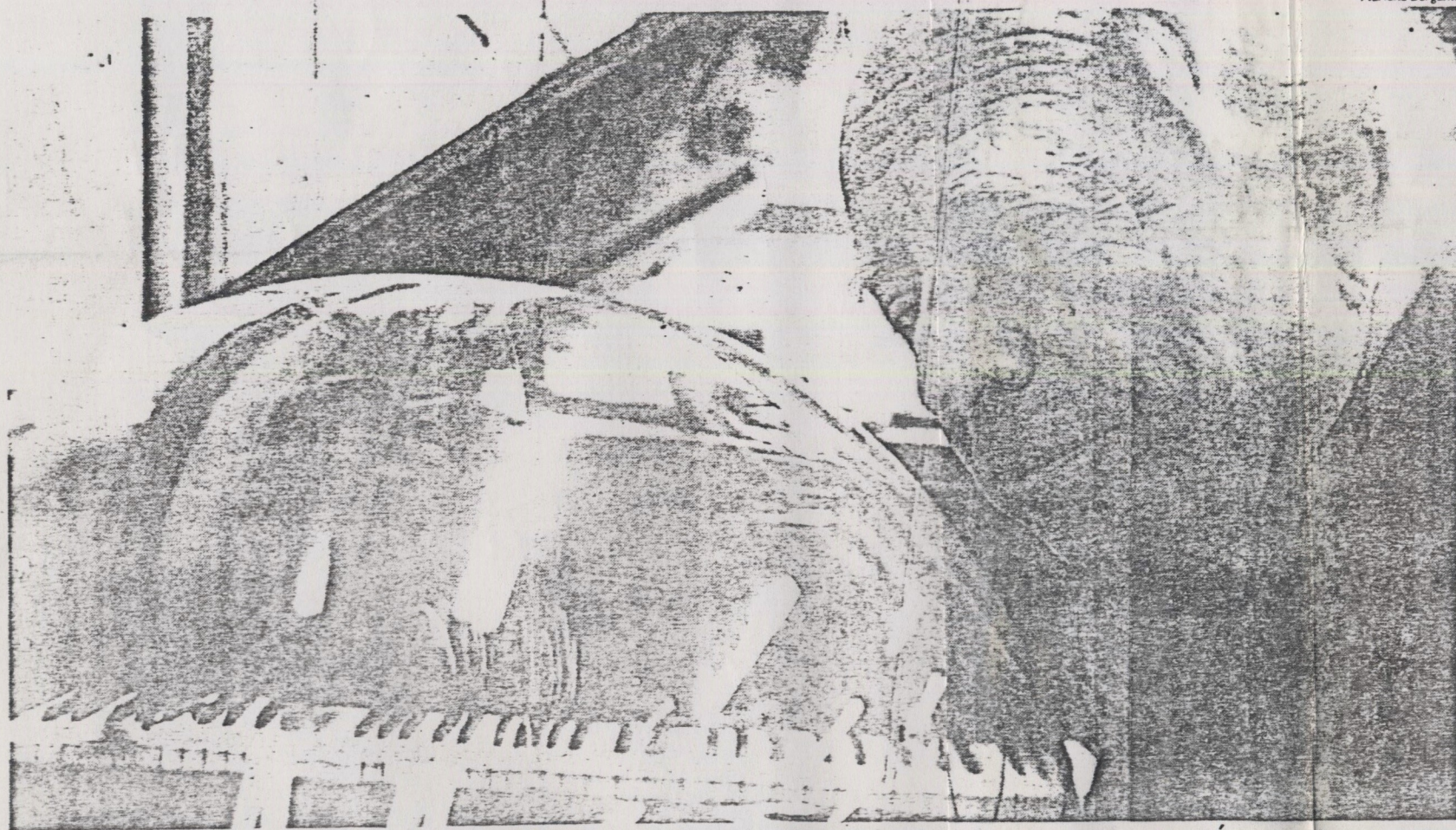
Compositor H.J. Koellreutter ao lado do globo de acrílico que contém 24 módulos de sua composição "Acronon", que será interpretada hoje, amanhã e domingo pela Orquestra Experimental de Repertório no encerramento do Festival Música Nova