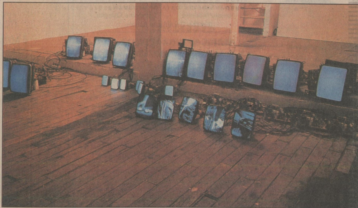
'Between Cinema and a Hard Place', instalação de Hill de 1991: baseada em Heidegger