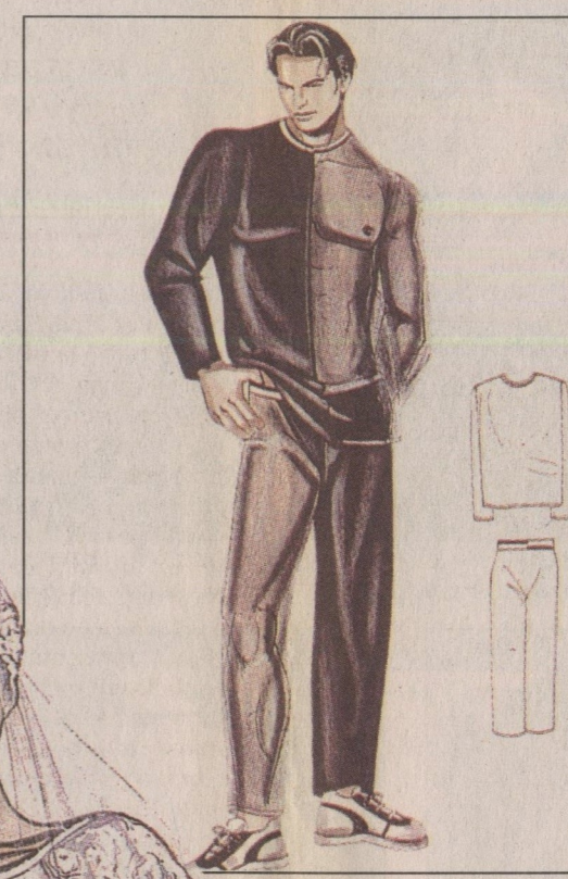
Figurino para Gil Romain: inspirado em Freddie Mercury