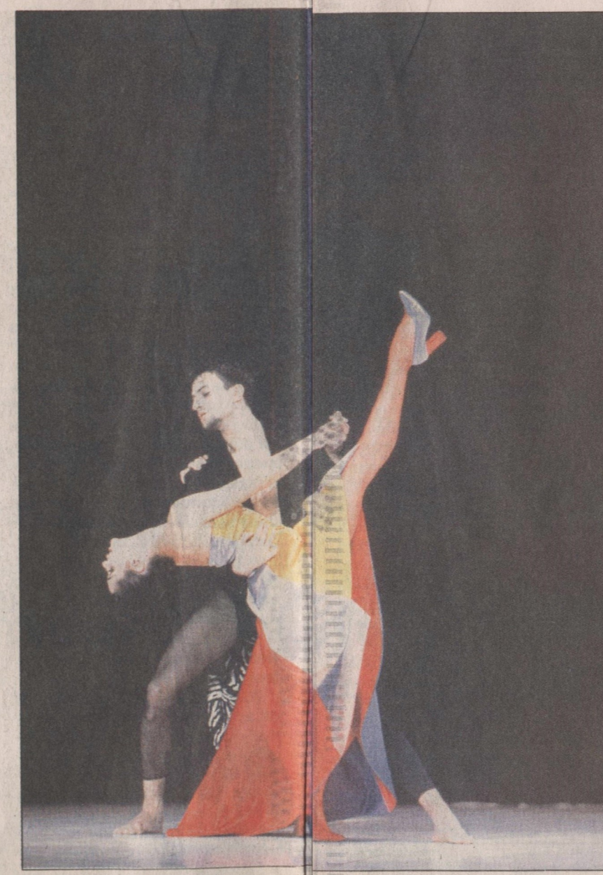
Criação com canções do Queen: coreografia como um audiovisual