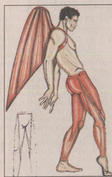
Uma das criações para o balé: um desafio