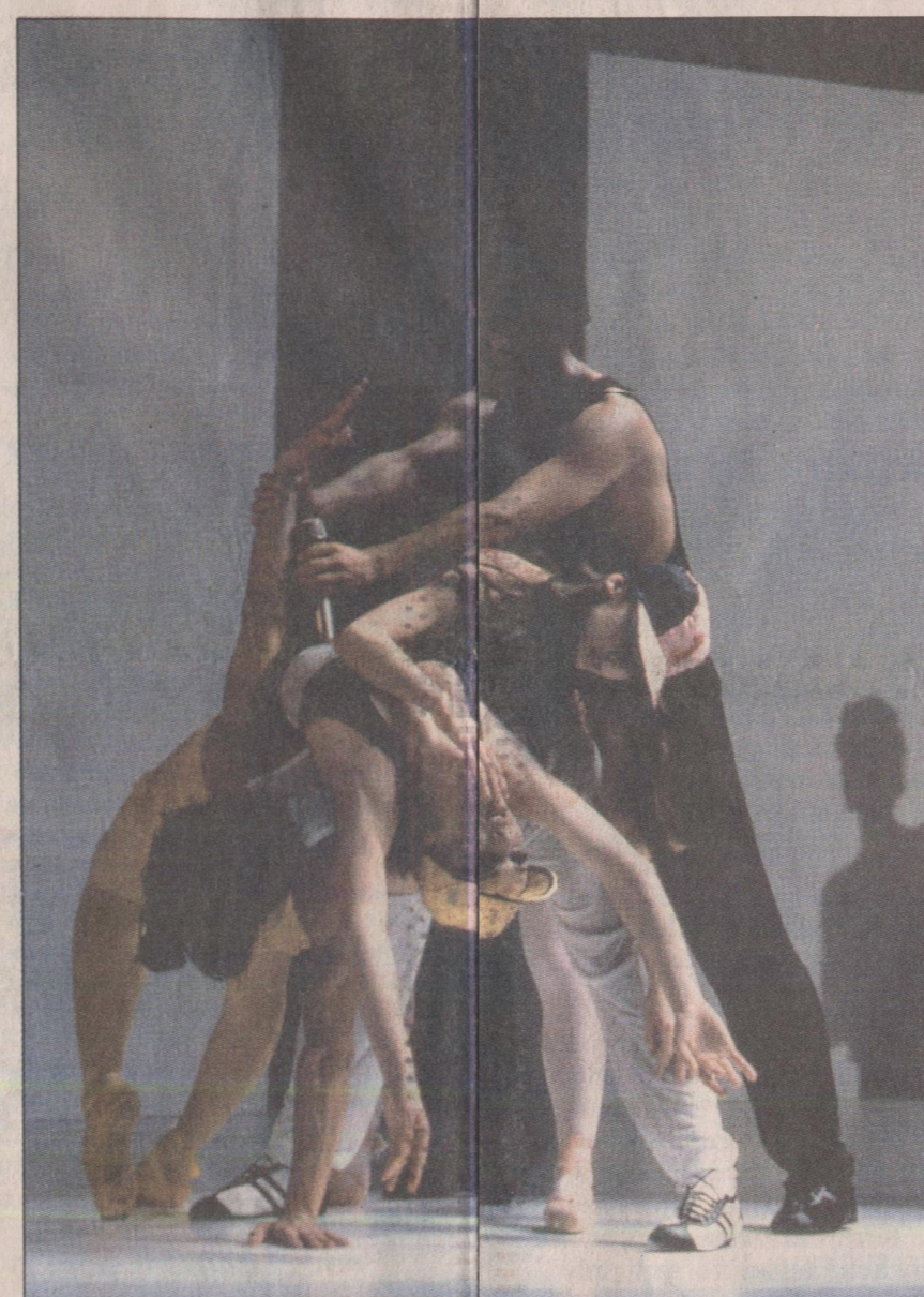
Cena do balé 'Le Presbytère': a extensa coleção de clichês