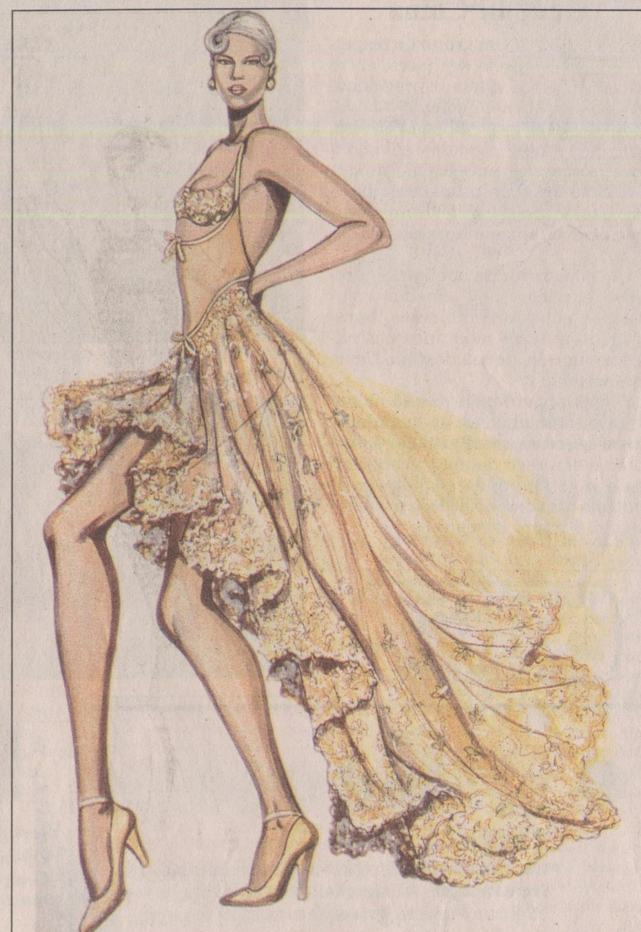
Um dos sensuais vestidos usados no balé (acima) e o manto vermelho debruado de pele (ao lado) que veste Gil Romain: reprodução do que foi de Freddie Mercury