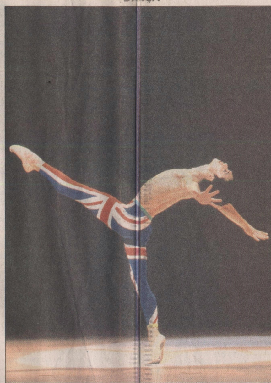
Malha com bandeira inglesa: homenagem ao líder do Queen

ENTRE SUAS OBRAS LITERÁRIAS ESTÃO ROMANCES E DOIS LIVROS DE MEMÓRIAS