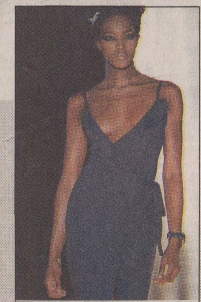
Naomi: desfilando para Versace

te-me explorar e experimentar, em profunda pesquisa, as ligações possíveis entre arte e artesanato", diz Versace.