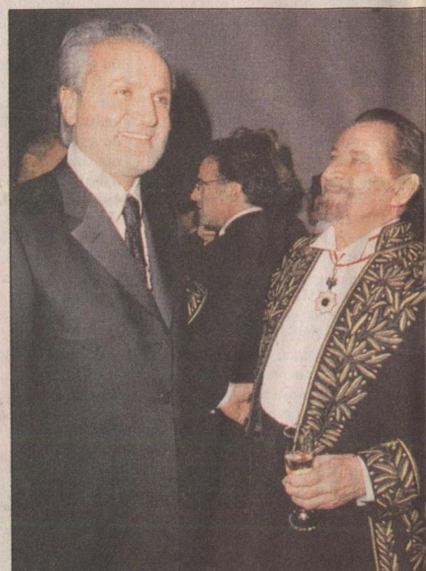
O estilista e o coreógrafo são parceiros em dez trabalhos: o primeiro foi realizado em 1983