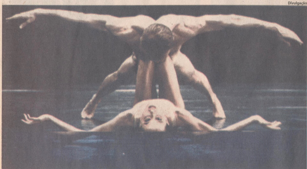
Cena de coreografia do balé Nederlands Dans Theatre, que se apresenta em São Paulo nos dias 25, 28 e 29

Espectáculo: Nederlands Dans Theater Onde: Teatro Municipal de São Paulo (pça. Ramos de Azevedo, s/nº, tel. 222-8698) Quando: dias 25 e 28, às 21h, e 29, às 17h Quanto: R$ 120, R$ 80, R$ 40, R$ 20, R$ 5 (setores 1 a 5)