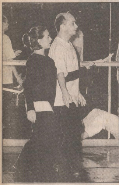
Pederneiras: uma assinatura

O novo balé estreará em São Paulo, dia 14 de setembro. Na Maison de la Danse, de Lyon, na França, onde o Grupo Corpo é companhia residente, ocorrerá a estréia européia, no dia 2 de dezembro. Nessa época, o CD com a trilha já estará pronto, para um lançamento simultâneo.