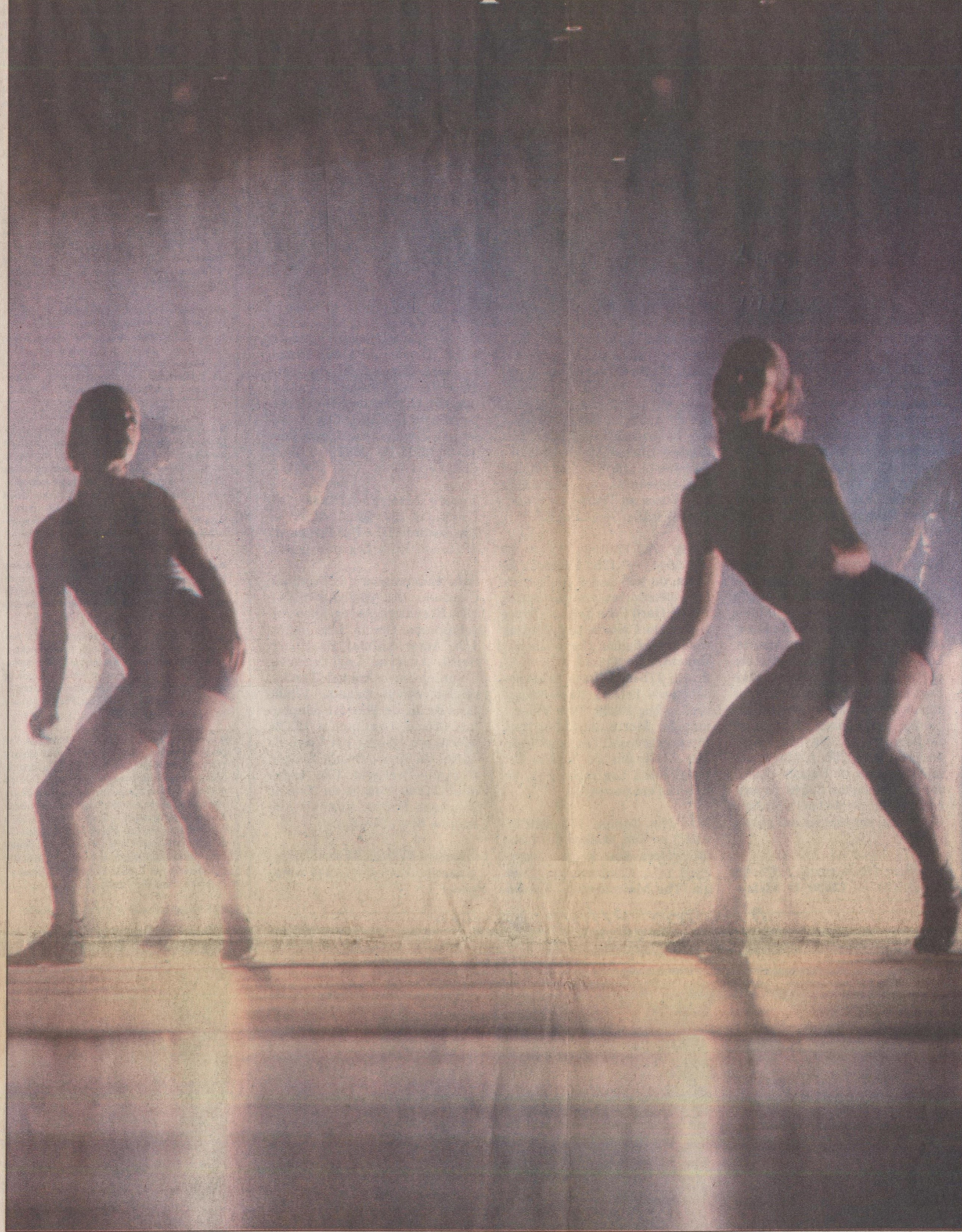
Cena do espetáculo 'Bach', dos mineiros do Grupo Corpo: prestígio e agenda lotada, com várias apresentações marcadas no Exterior

Pelo contrato com a Maison de la Danse, no ano que vem a estréia do novo trabalho do Grupo Corpo será em 1º de dezembro, em Lyon. De lá, seguirão para uma turnê francesa, até o Natal. Um pouco antes, em setembro e outubro, a companhia terá dançado peças do seu repertório nos Estados Unidos. No primeiro semestre, a agenda desses mineiros também será internacional: Israel, Finlândia e