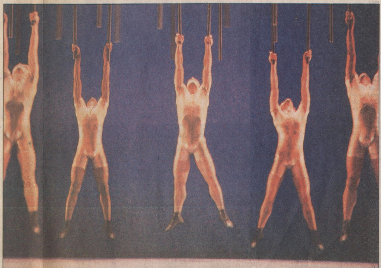
Conquistas importantes da companhia: viagens e compromissos na Europa e nos Estados Unidos