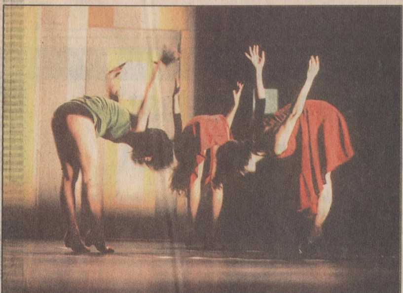
'A Cozinha': "Humor e sensualidade são importantes", diz Sasha