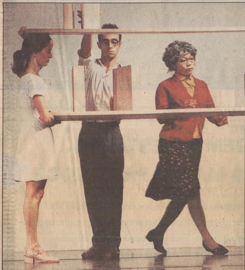
Sasha Waltz & Guests: bailarinos num espaço aberto, sem limites

Sasha — Pura coincidência. Encontrei-os em lugares bem diferentes. Não fiz audições com eles, mas escolhi-os pelo que estavam fazendo. Questão de fato. A bailarina japonesa descobri em Berlim. Ela veio no meu workshop de dança e foi ali que a escolhi. O francês dançava num bar, falei-lhe do meu projeto, ele aceitou, mas só o chamei três anos depois. A americana foi minha colega em Amsterdã. O austríaco vi em Viena, quando fazia um solo. No espetáculo que levarei ao Brasil, há dois canadenses, um espanhol, dois italianos e Takako. As diversas nacionalidades acabam sendo um fator ótimo, porque cada um traz no seu background coisas diferentes que nos enriquecem.