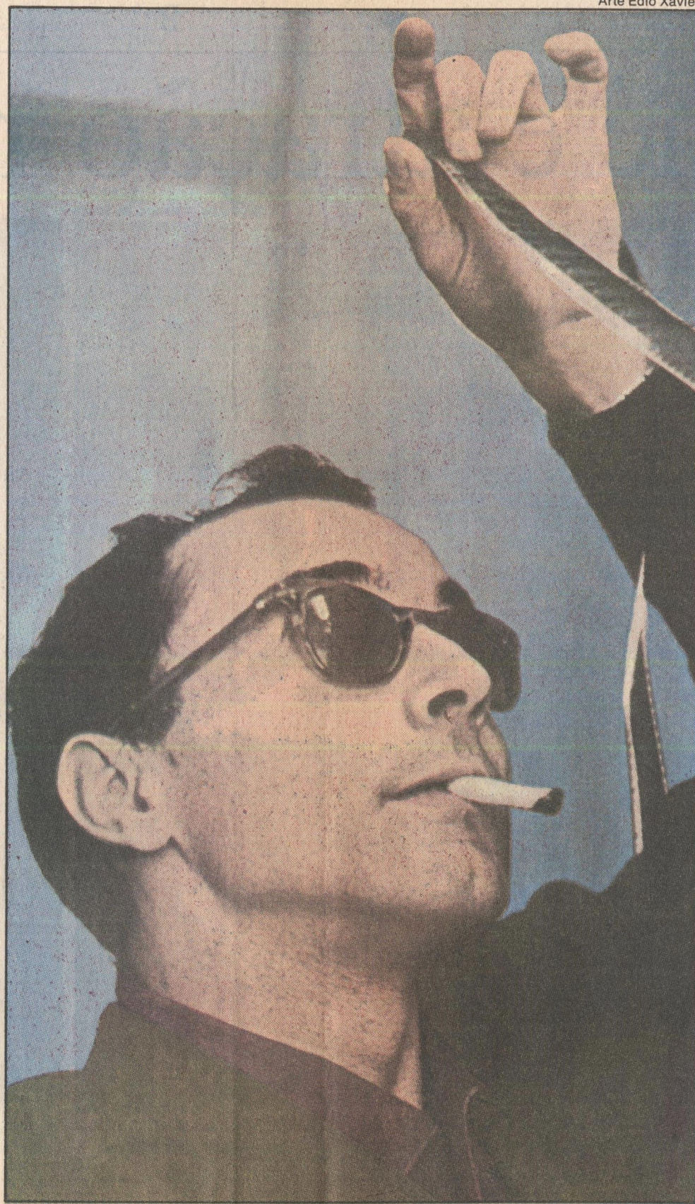
Godard: "Em 1993, quando realizei este filme, estava passando fome"

Com voz grave e macia, lê passagens das obras favoritas, como a Experiência interior , de Diderot. Quando cansa, leva a câmera para testemunhar seu talento nas quadras de tênis. A seguir, passeia pela floresta e tenta até caminhar sobre