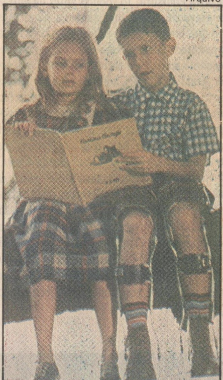
Forrest Gump: uma bobagem