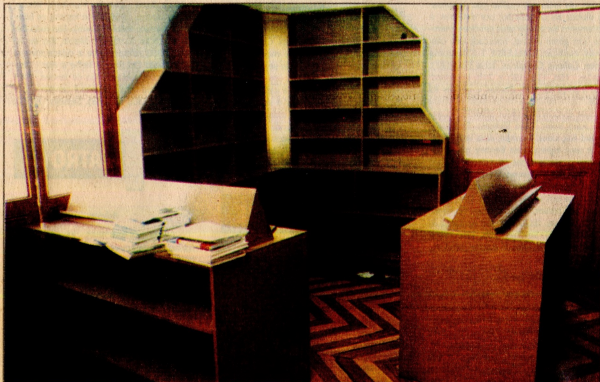
No Victoria funcionavam uma livraria, um bar, duas salas de cinema e uma videoteca