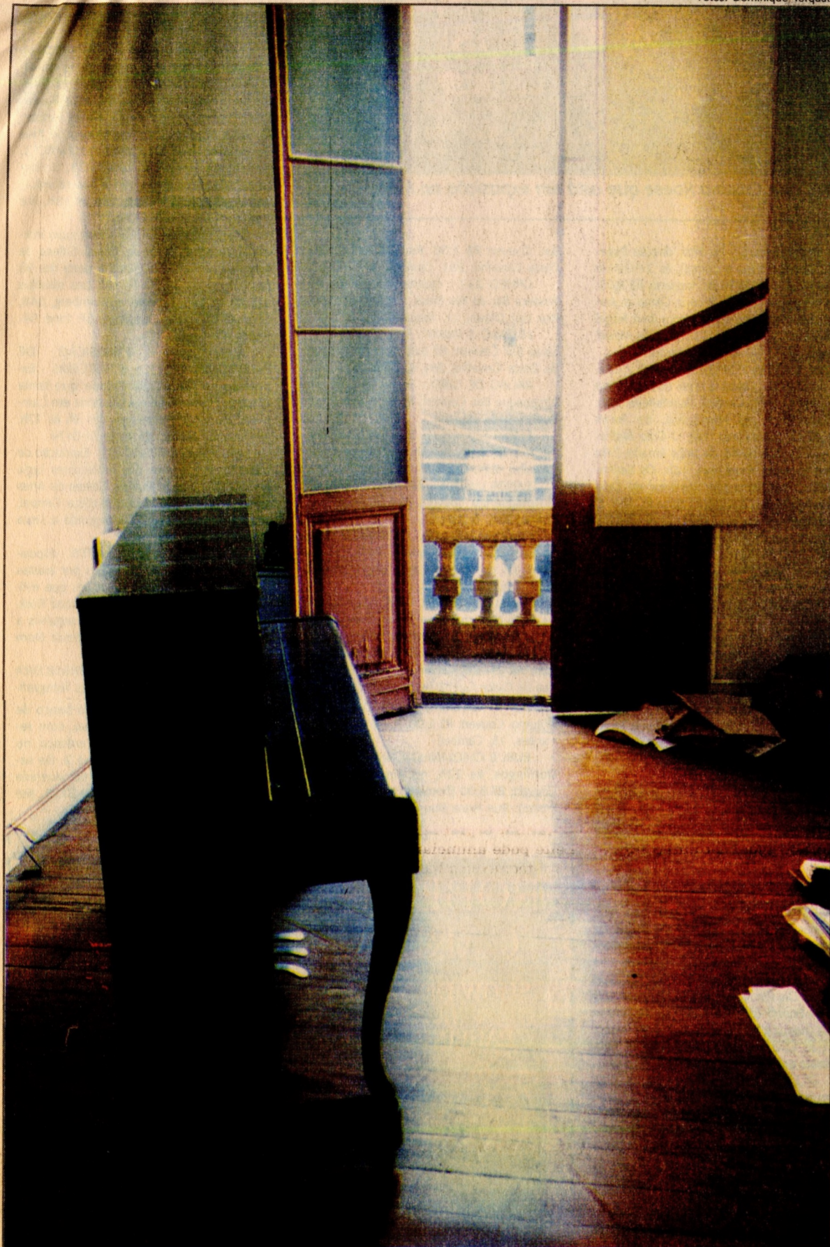
Parte da mudança já foi levada ontem para um depósito pela empresa de transportes Granero

O Centro Cultural Victoria, que está sendo despejado, tem dívida decorrente de atrasos no aluguel e no IPTU estimada em R$ 25 mil