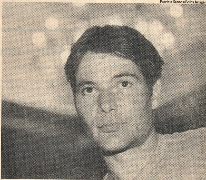
O coreógrafo David Parsons, que dançou ontem em Salvador

Parsons define seu trabalho como "só dança". "Não tem fala, não é teatro, não tem cenário, não tem figurinos exagerados", diz, ao