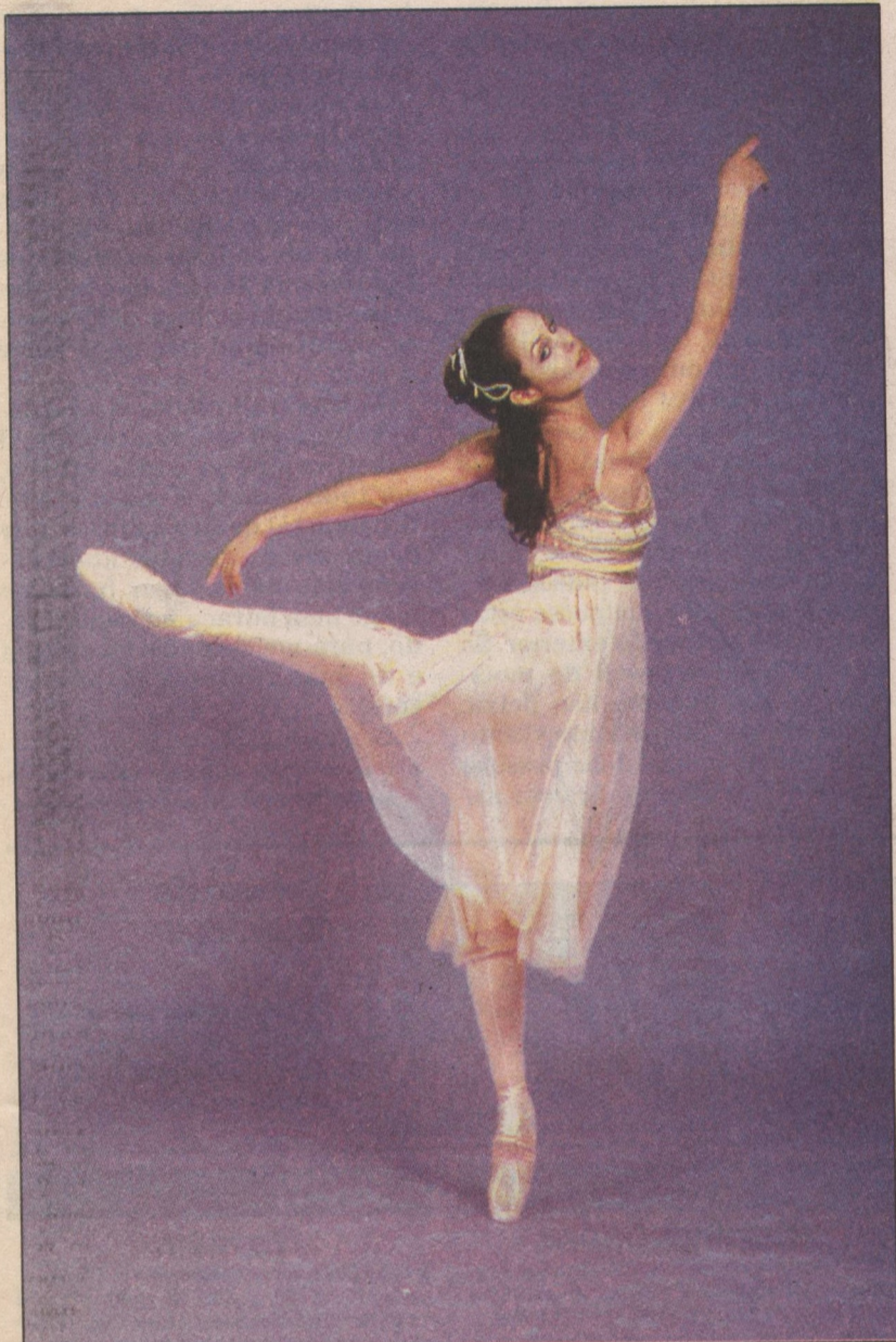
'Déluge', de Ginette Laurin: unindo medieval e contemporâneo