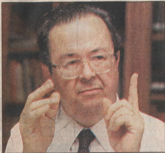
O ministro da Cultura, Francisco Weffort: encontro tem mais de mil artistas convidados e 300 pessoas envolvidas na organização

O encontro é pródigo em espetáculos de toda natureza. No fim de