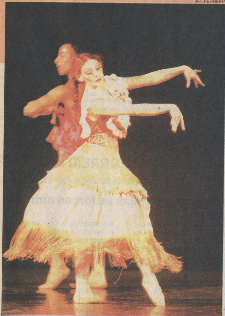
Um dos momentos do espetáculo apresentado pelo Ballet Stagium

Depois de uma reunião no Museu Republicano, o próprio regente a nomeou presidente da Sociedade que, entre as finalidades, está a de promover eventos com verba revertida às atividades da Fundec.