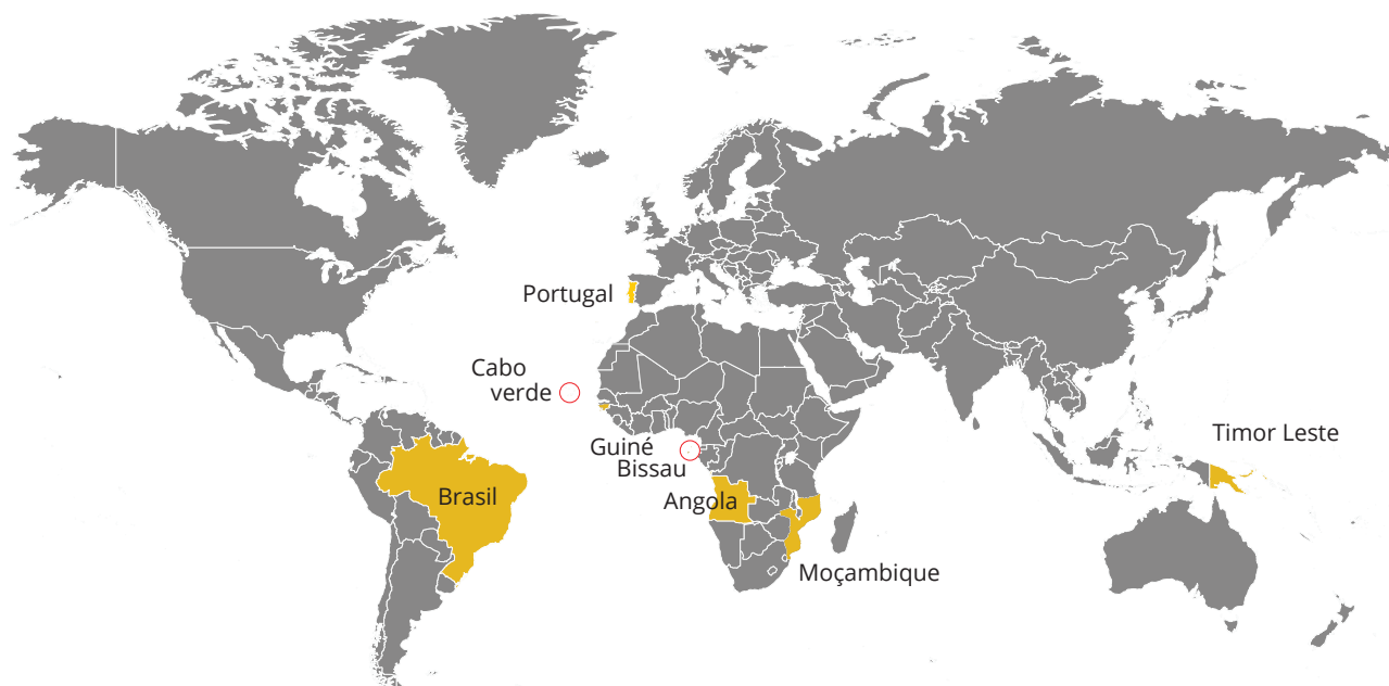
Figura 01. Países que falam português.