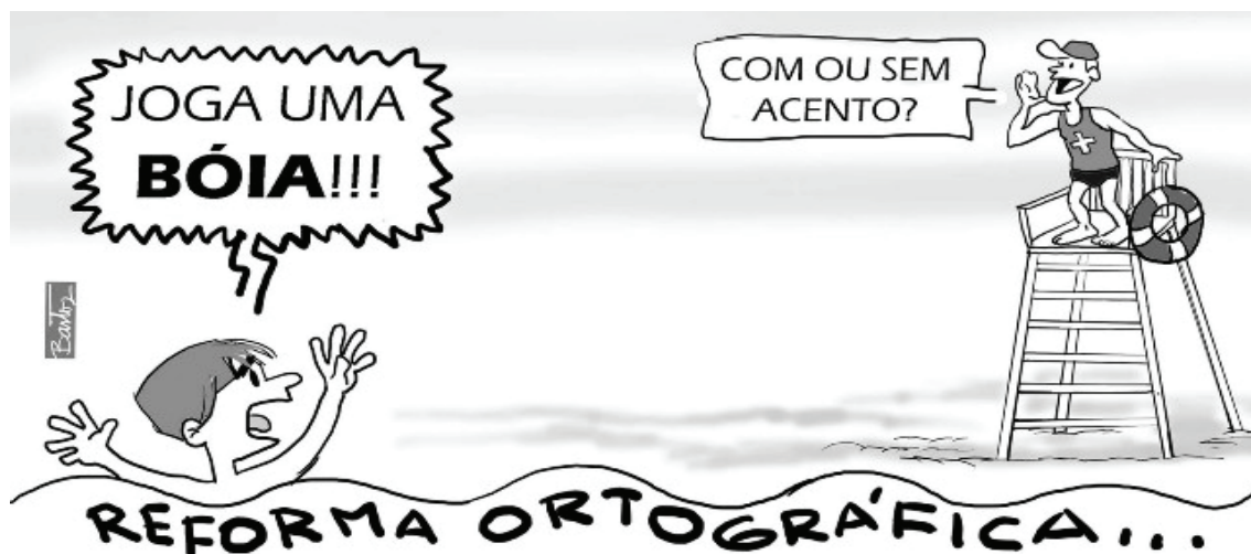
Figura 02: Charge Novo Acordo Ortográfico.