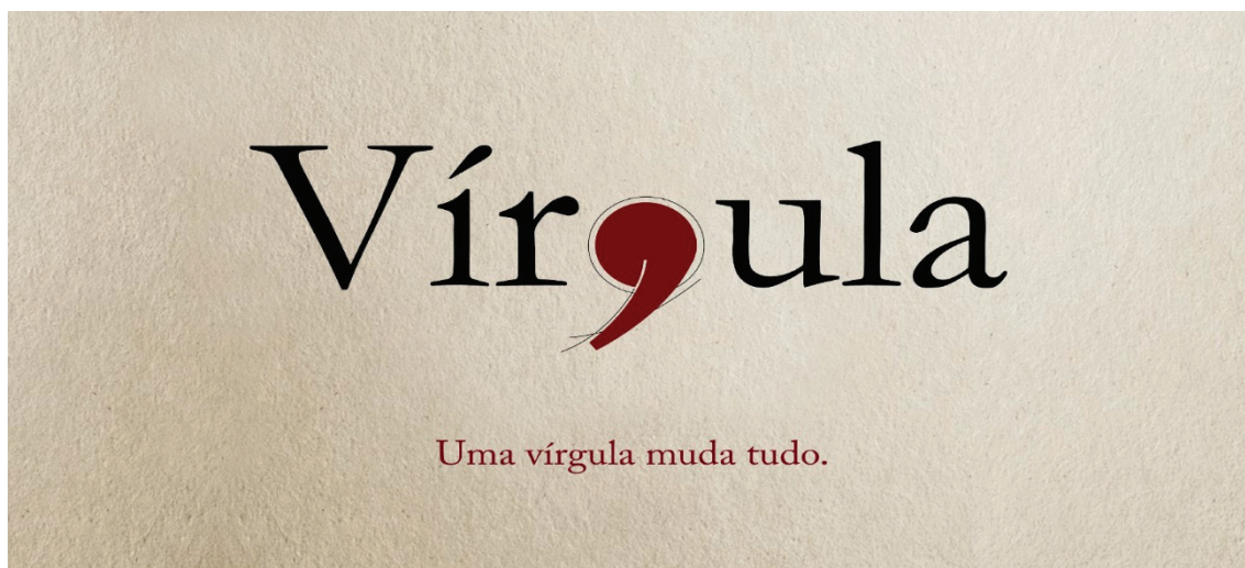
Figura 03: Uma vírgula muda tudo.