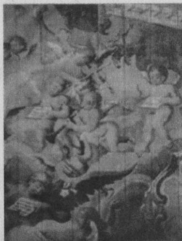
Capa de Música do Período...