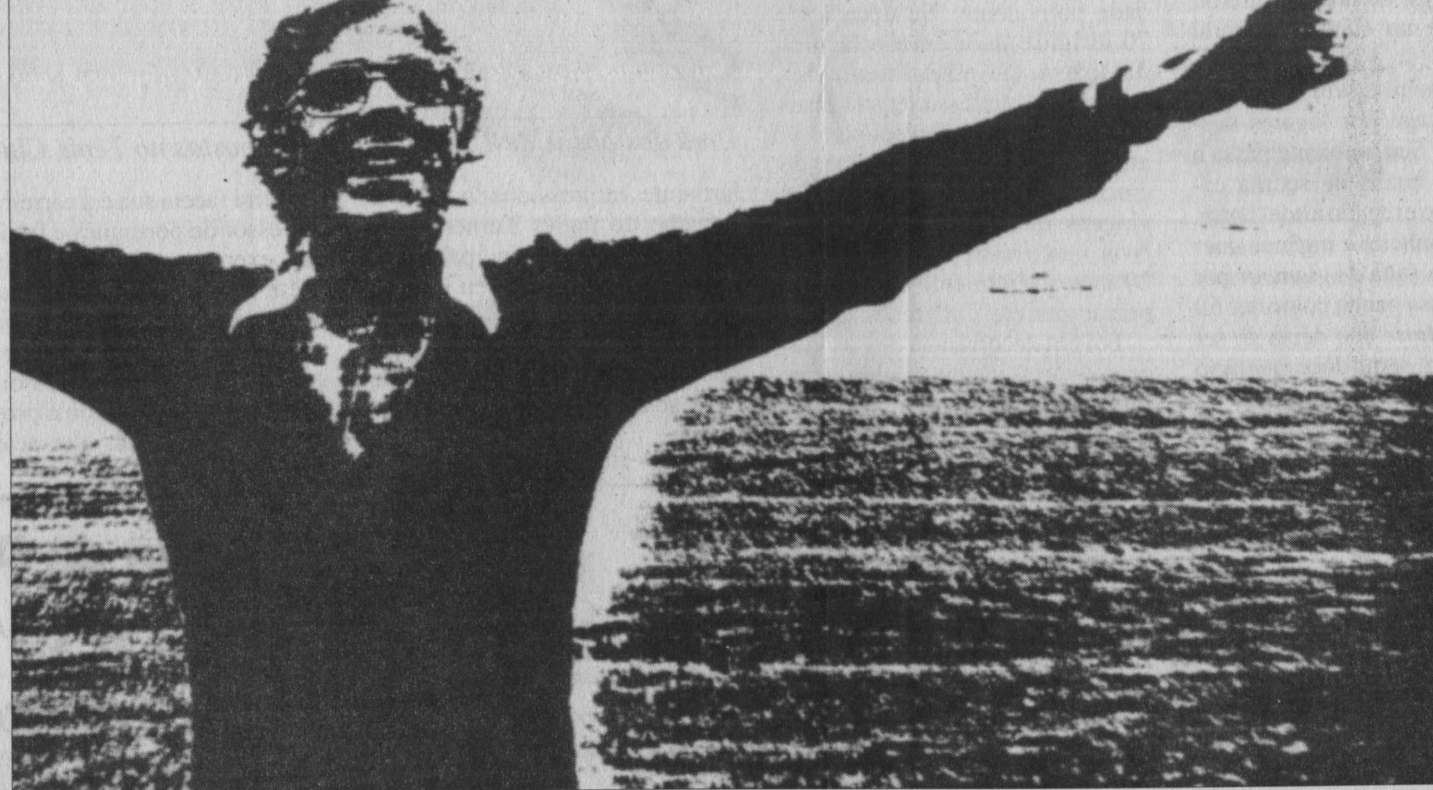
Nascido em Santos, Gilberto Mendes é o principal expoente da chamada música contemporânea no Brasil

ter horror à ignorância, como uma coisa perigosa à natureza humana, às relações entre os homens. Por outro lado, me envolvia o mundo da fantasia kitsch de Hollywood, verdadeiro Olimpo surrealista de nosso século..”