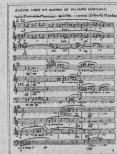
Uma partitura de Mendes

ter horror à ignorância, como uma coisa perigosa à natureza humana, às relações entre os homens. Por outro lado, me envolvia o mundo da fantasia kitsch de Hollywood, verdadeiro Olimpo surrealista de nosso século..”